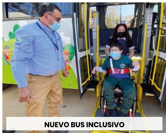
NUEVO BUS INCLUSIVO