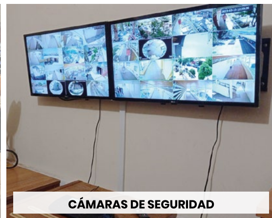
CÁMARAS DE SEGURIDAD